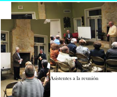
Asistentes a la reunión