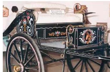
Un sulky fileteado por Alberto Pereyra

la que representa la celebración de la prosperidad en el trabajo. Decoración de los transportes del Mercado de Abasto, carros, camiones y fundamentalmente colectivos.